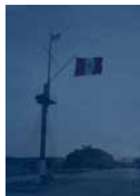
Contraportada: El Palo Unión en la Escuela Naval del Perú.

Revista de Marina. - Año 111, n. 1 - 2018. - Lima: Fondo Publicaciones, Dirección de Intereses Marítimos, 1907 - 2018 V.; 23.5cm. X 17.5cm. Cuatrimestral ISSN: 1012-8247 I. Perú. Marina de Guerra - Revistas. I. Perú. Marina de Guerra. II. Dirección de Intereses Marítimos, Fondo de Publicaciones.