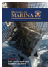
Portada: El Unión y su homenaje al Inca navegante, Túpac Yupanqui.

Para sugerencias y comentarios escribanos al e-mail: revismar@marina.pe